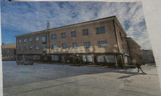
Vanha Etelä-Pohjanmaan puhelinliiketoiminnan keskustalo sijaitsee Seinäjoella Puskantien ja Työväenkadun kulmassa. Nykyään sen omistaa Loihde.